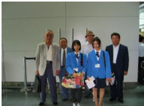
YCE夏期派遣生見送り

今こうして一覧表にしてみますと、ACT関連記事内容はYCE・青少年指導委員会と社会福祉公衆安全の二つに偏ってしまっています。これは前年度に私がYCE・青少年指導委員会委員長であり、社会福祉・公衆安全委員会と合同ACTを行ったことなどによりACTの印象に強い思い入れがあったのではないかと思います。他の事業委員会のACT関連記事を掲載できなかったことにつき大変申し訳なく、会報としてこれで良かったのかと、深く反省をいたしているところです。