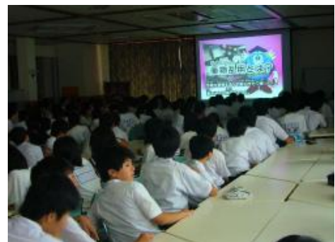
薬物乱用防止教室