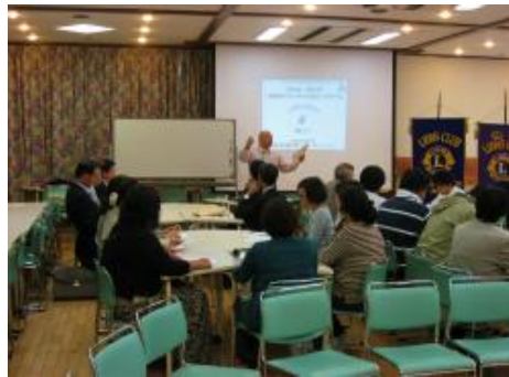
ライオンズクエストセミナー体験会