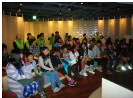
オレンジリボン・キャンペーン