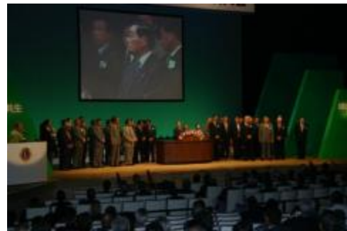
来年の地区年次大会は豊田です。