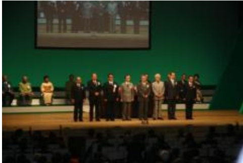
334-A 地区リジョンチャーパーソン勢揃い