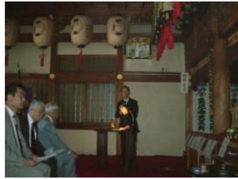
会長 L 速水挨拶