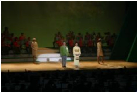
ガバナーL奥村夫妻の入場