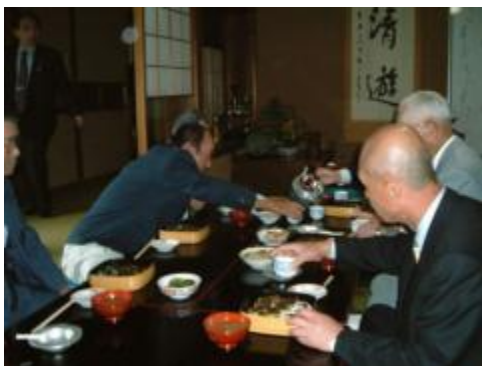
法要例会の後の食事の風景