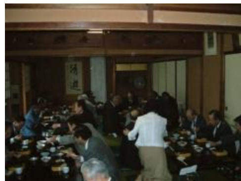
法要例会後の食事の風景