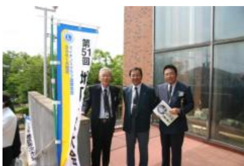
出席した証拠写真です

最初に木曾川高校吹奏楽部と一宮市消防音楽隊のオープニング演奏会で始まり、多くのライオンズメンバーは感動していました。その後大会式典にはいりました。