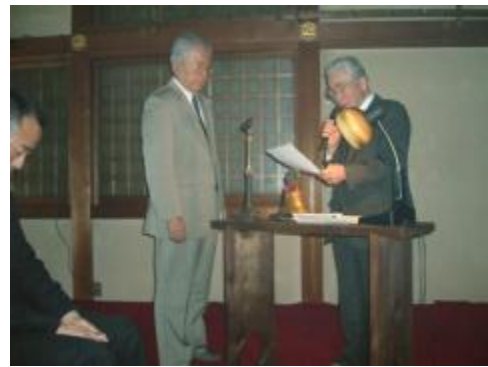
昨年度スポンサーをされた実績 に対し国際会長より表彰を受けました