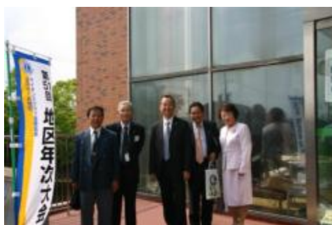
最近なぜか笑顔が多い会長を囲んで