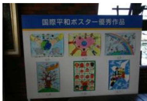
今年度の平和ポスター優秀作