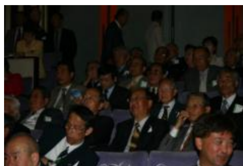
客席風景。 次期3役が熱心に聞き入っています