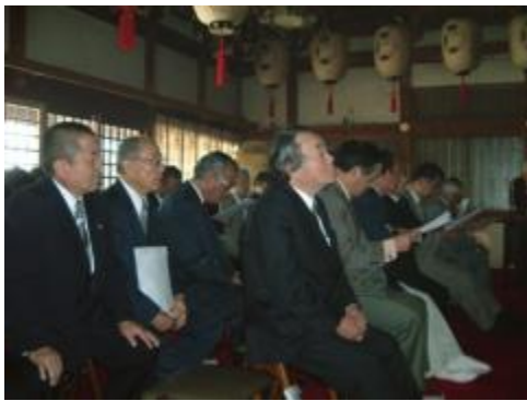
在りし日の仲間の姿を思い起こすメンバー