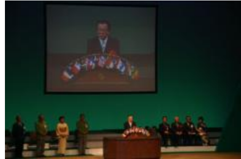
神田知事よりお祝辞を頂きました