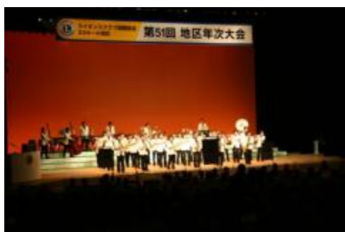
式典前のセレモニー