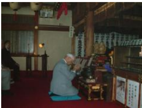
物故ライオンのご冥福をお祈りする L 河瀬