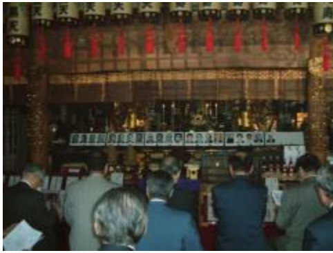
21名の物故ライオン