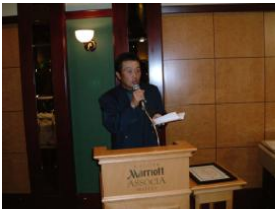
メジャーリーグ観戦 チケットオークションを行った テールツイスター L大藪