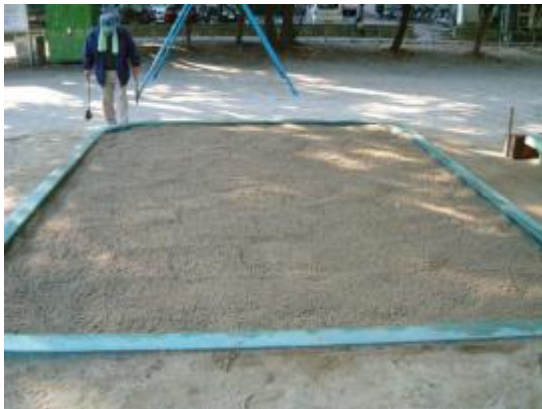
砂場もご覧の通り 子供達の笑い声が聞こえそうです