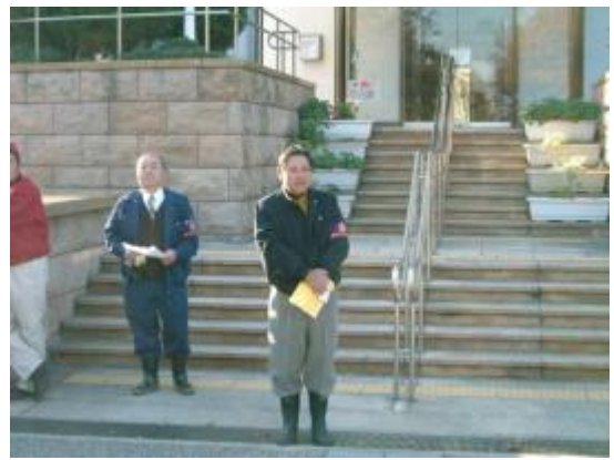
環境保全委員長 L吉金あいさつ