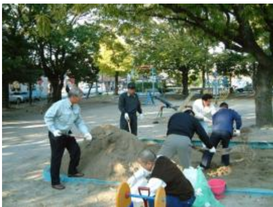
多くの子供達の笑顔の為に