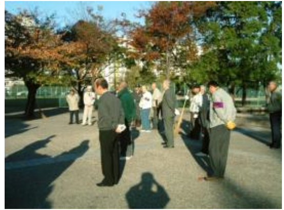
朝早くから大勢のメンバーが 集まりました。