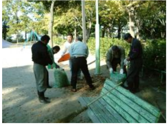
たくさんの落葉に悪戦苦闘