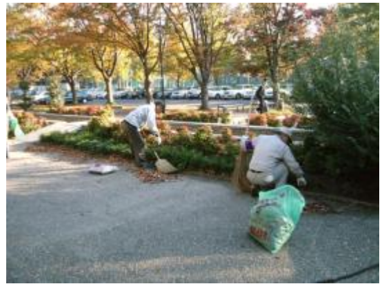
落葉の多さに冬を感じます