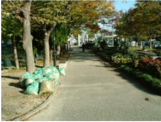
掃除も終わり きれいになりました