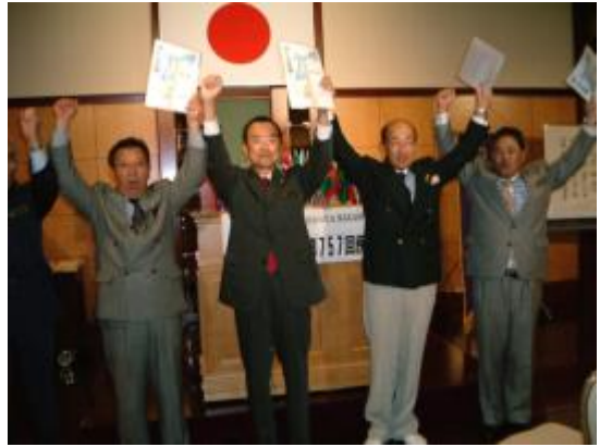
11月 誕生日の皆さんでロアー