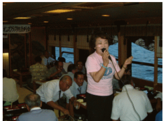
L花房 うまい！また聞かせて下さい