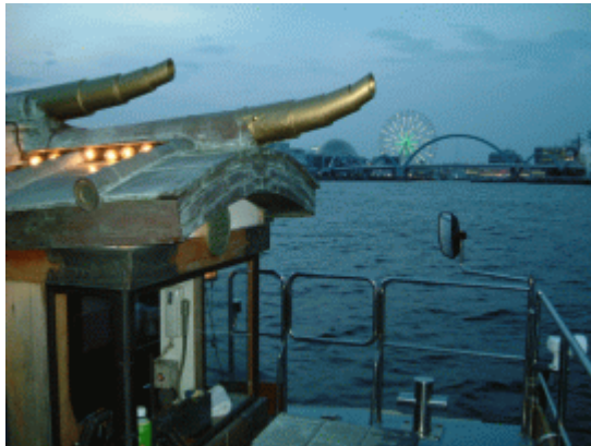
港も変わってきました