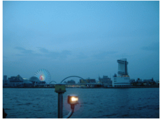
ちょっと涼くなりました。