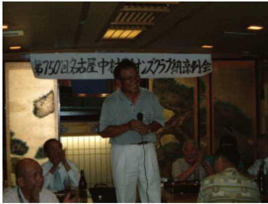
L遠藤 女房が一番。今年は楽しい例会にします。