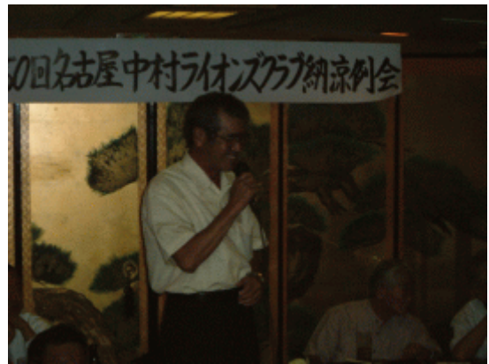
L日置 男の歌は日本一