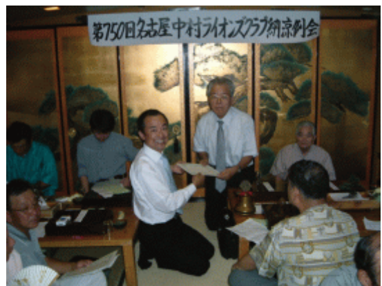
委嘱状の授与 L大場ZC1年間宜しくお願いします。