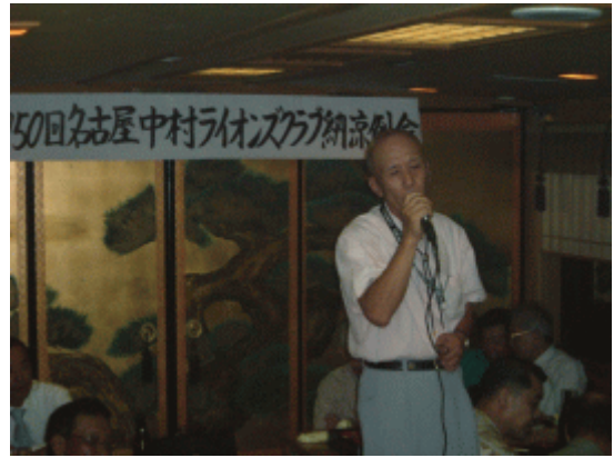
L後藤 歌は任せなさい。