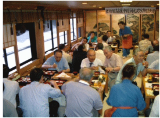
飲んで暑さを吹き飛ばすぞ