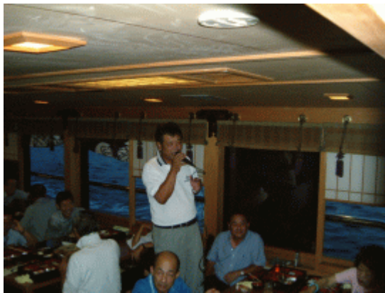
L前川 目指すはL大竹です。