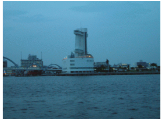
港まで来ました。そろそろ日没です。